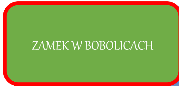
ZAMEK W BOBOLICACH