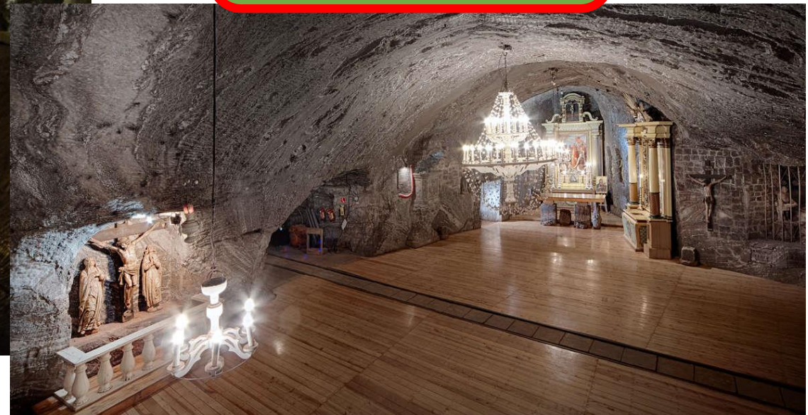
KOPALNIA SOLI W BOCHNI