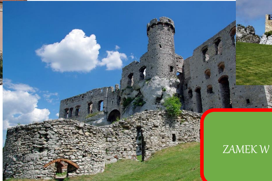
ZAMEK W OGRODZIĘNCU