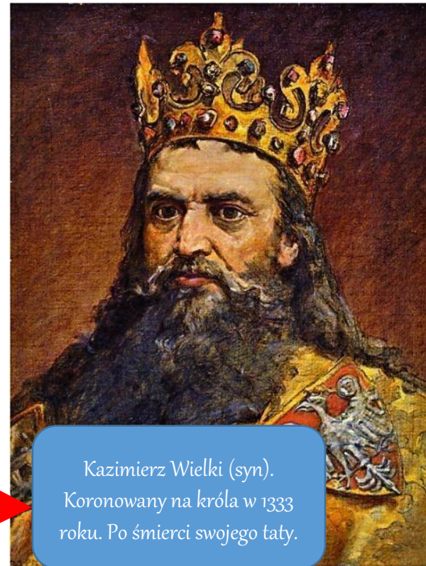
Kazimierz Wielki (syn). Koronowany na króla w 1333 roku. Po śmierci swojego taty.