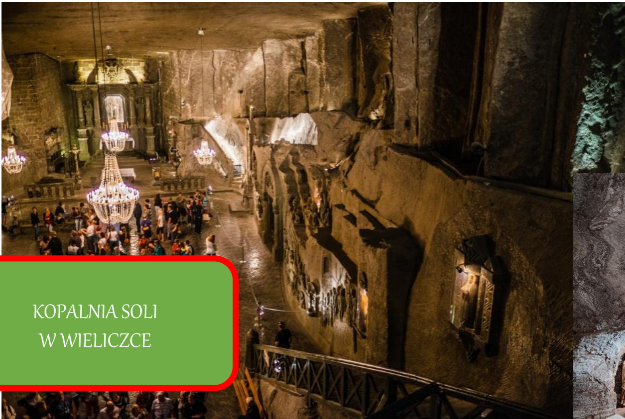
KOPALNIA SOLI W WIELICZCE

4. Wzbogacił państwo i ujednolicił prawo. Kazimierz Wielki wspierał handel i pilnował żeby do kasy państwowej wpływały podatki. Ponadto uporządkował zasady wydobywania soli, która była wtedy nieprawdopodobnie cennym surowcem i źródłem bogactwa naszego państwa...i króla 😊.