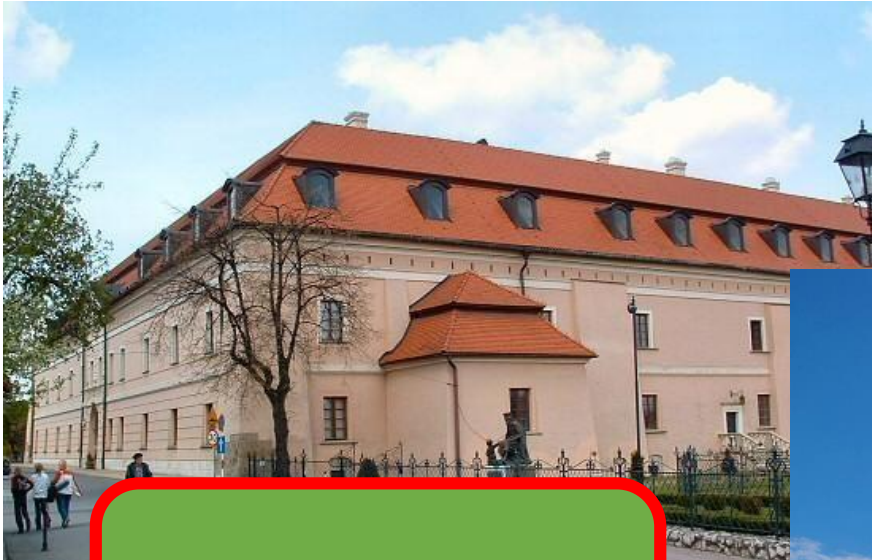
ZAMEK W NIEPOŁOMICACH